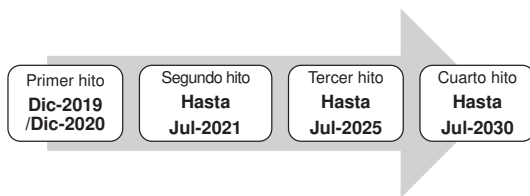
Gráfico N° 1: Hitos temporales del Plan Nacional de Competitividad y Productividad

El primer hito temporal responde al seguimiento de medidas de corto plazo que representan las etapas iniciales de medidas en implementación. El segundo hito temporal representa los logros del gobierno hacia el Bicentenario y está vinculado con los objetivos establecidos en el Decreto Supremo N° 054-2011-PCM, en tanto sus Ejes Estratégicos incluyen fines que han sido recogidos en la PNCP. El tercer hito, julio 2025, corresponde a los logros hacia el mediano plazo. Finalmente, el cuarto hito, hacia julio de 2030, corresponde a los logros de largo plazo, vinculados a los Objetivos de Desarrollo Sostenible. El horizonte temporal planteado, abarca tres administraciones gubernamentales, lo cual es consistente con el propósito de la PNCP de representar una política de Estado y no de un solo gobierno.