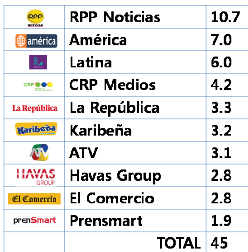
Montos expresados en millones de soles (S/.)