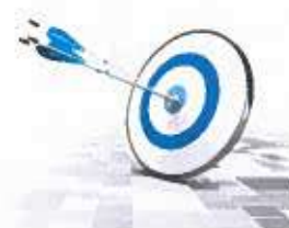
Cuadro N° 1 Objetivos Estratégicos Institucionales