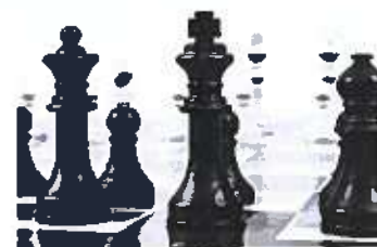
Cuadro N° 2 Acciones Estratégicas Institucionales