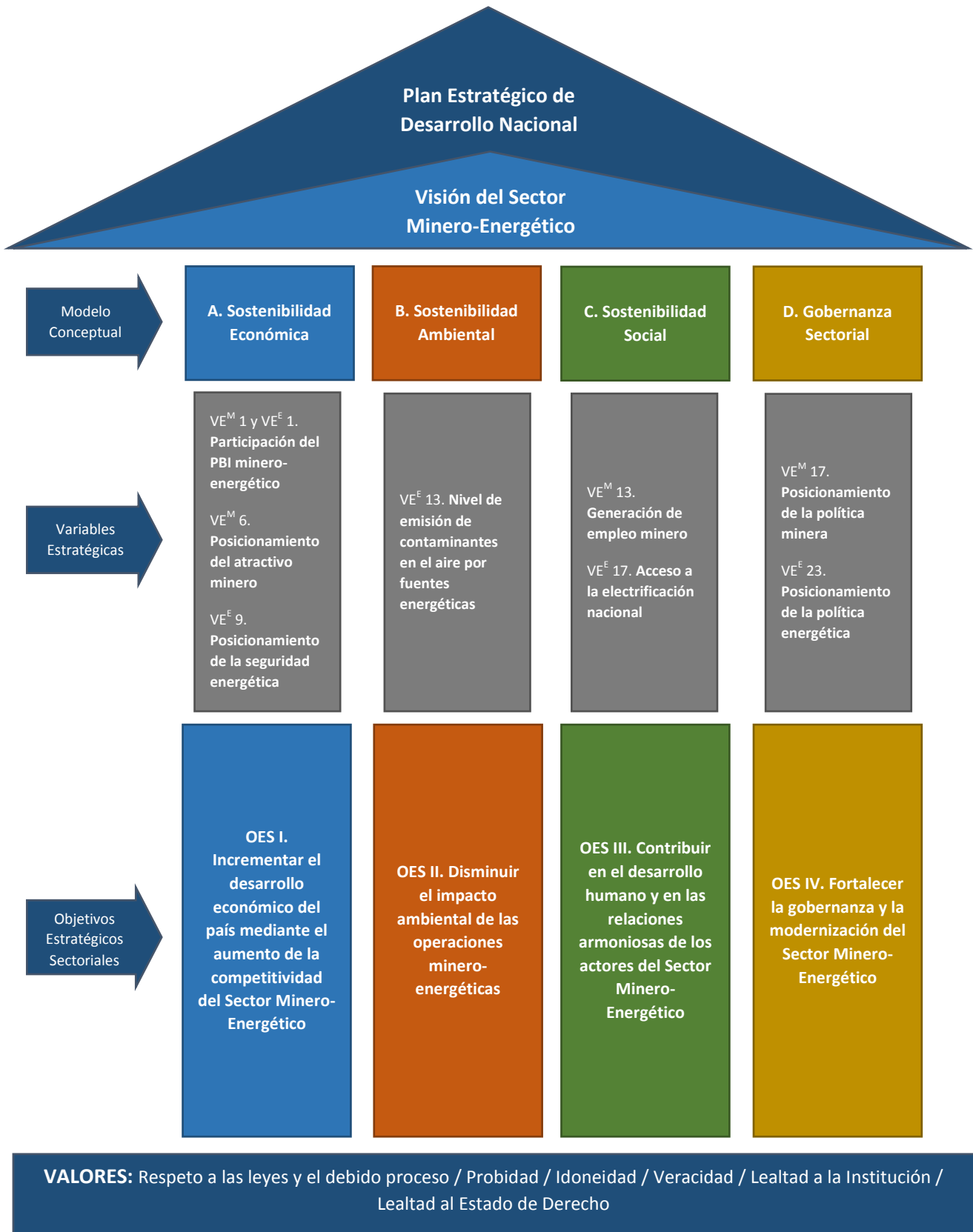
Gráfico N° 2 Estrategia para el Sector Minero-Energético